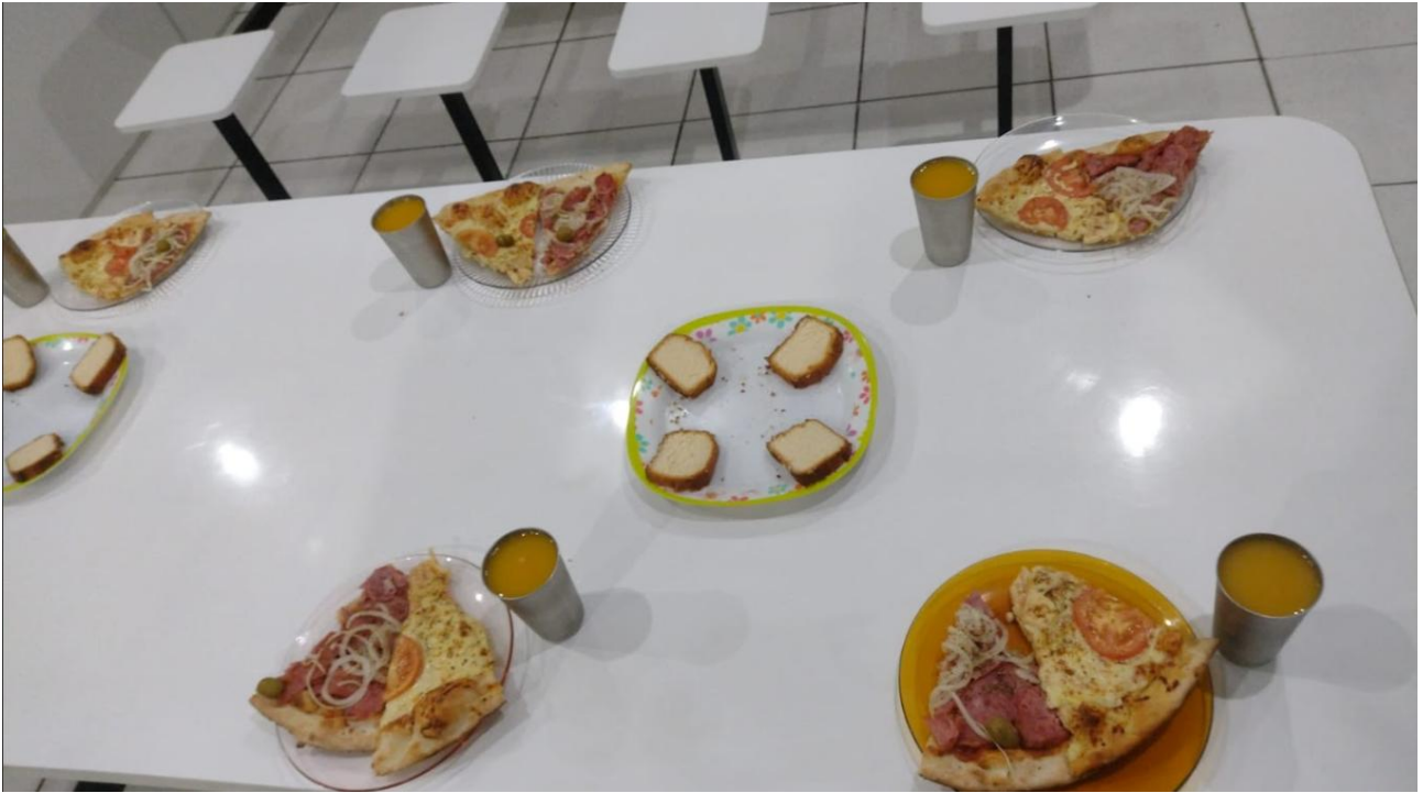
Figura 2: Noite da Pizza 10/07/2025